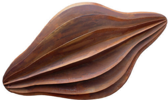
Herbert Mehler Skulptur